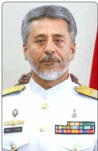
از ارزش های انقلاب و دین گرفته شده و میزان توجه به ایمان و اعتقاد در ارتش بسیار بالاست.

وی با تأکید بر اهمیت نقش معنویت در ارتقای