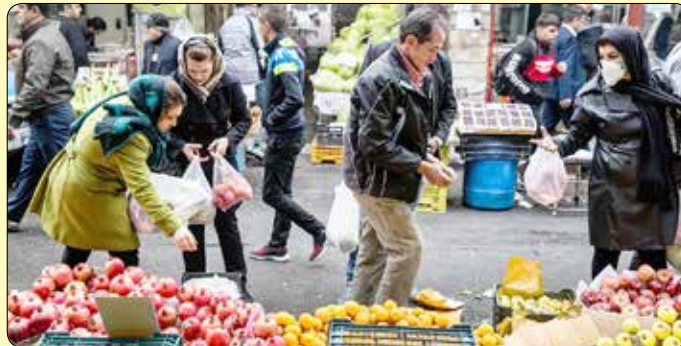
ساماندهی مشاغل شهری و فرآورده های کشاورزی شهرداری کرج ادامه داد: میداین جمعه در شیفت عصر تعطیل بودند.

معاون اجرایی و ساماندهی مشاغل سازمان ساماندهی مشاغل شهری و فرآورده های کشاورزی شهرداری کرج: میداین و بازارهای میوه و تره بار برای خدمت رسانی به شهروندان در شب یلدا از صبح تا بعداز ظهر باز هستند.