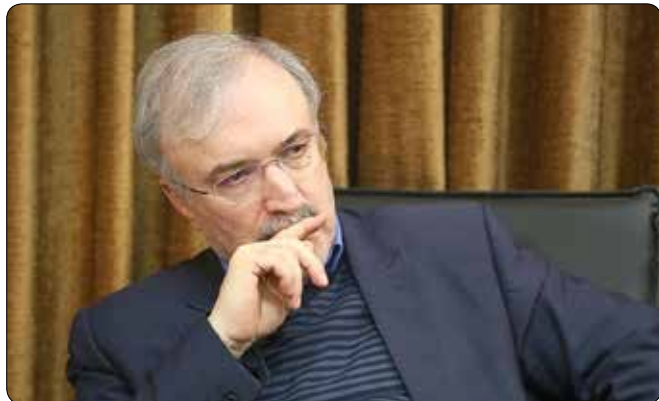
مشخص شود. مبنی بر وجود قرص و کپسول در کیک و برخی فرآورده های غذایی منتشر شد. اواخر هفته گذشته تصاویری در فضای مجازی

وزیر بهداشت، درمان و آموزش پزشکی گفت: موضوع جاسازی قرص در کیک ها امنیتی است که با هدف تشویش اذهان عمومی و تخریب صنعت غذایی انجام شده است.