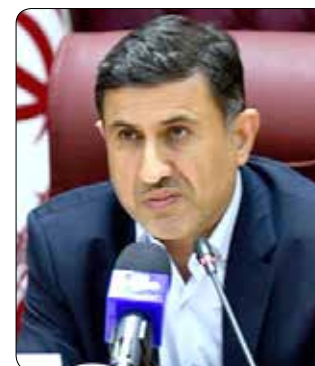
نماینده عالی دولت در استان البرز گفت: توسعه و تسریع در پیشرفت پروژه های راه سازی البرز با توجه به حجم بالای