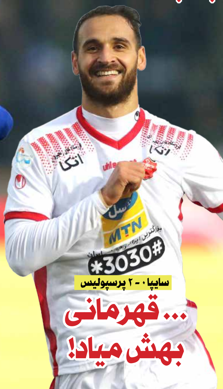
سایپا ۰ - ۲ پرسپولیس