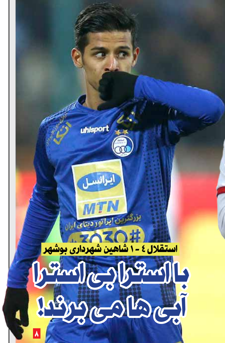
استقلال ۴ - ۱ شاهین شهرداری بوشهر