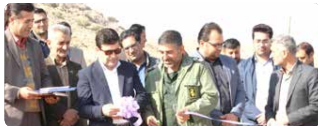
احیاء و غنی‌سازی جنگل انجام پذیرد.

پروژه بیولوژیک غنی‌سازی جنگل و احیای ۲۲۰ هکتار از عرصه‌های مستعد منابع طبیعی شهرستان پاسارگاد با گونه‌های بومی بانه، ارژن و بادام کوهی آغاز شد.