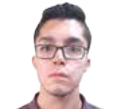
محمد حسین سیفی

«سیاوش اسعدی» کارگردان کم کار و شاید بتوان گفت گزیده کاری است. فاصله افتادن میان ساخت آثار او تقریباً اتفاقی عادی شده است و همواره ثابت کرده که کوچکترین عجله‌ای برای ساختن فیلم‌هایش ندارد و این خبر خوبی است آن هم در شرایطی که نسل جوان تزریق شده همانند «سعید روستایی»، «محمدحسین مهدویان» و... هر سال بی‌وقفه در حال کار کردن هستند و به نظر می‌رسد وقت چندانی برای سیر و سلوک در جهان شخصی خودشان خرج نمی‌کنند (فارغ از کیفیت آثارشان). اما اسعدی که «حوالی اتوبان» را در سال ۸۷ ساخت و تحسین مخاطبین را به عنوان فیلم اول بر انگیزت، برای ساختن فیلم دوم یعنی «جیب بر خیابان جنوبی» که فیلم بهتری هم بود سه سال صبر کرد و حالا می‌بینیم که میان فیلم دوم و سوم یعنی همین «در خونگاه» فاصله زمانی هفت ساله افتاده است. فاصله‌ای که نوید رشد فاحش اسعدی در «کارگردانی» را می‌دهد و شاید خودش هم اکنون راضی باشد که از هفت سال در سینما فعالیت خاصی نداشته است!