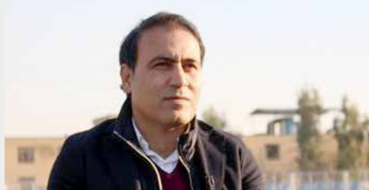
نشان داده که شاید در آینده به پست های مدیریتی نیز راه یابد.

این قانون می‌تواند در زمین مسابقه یا خارج از آن و مربوط به باشگاه‌ها باشد. در سال‌های اخیر قوانین زیادی در دنیای فوتبال تغییر کرده و حالا مهدی مهدوی کیا بخشی از گروهی خواهد بود که در این تغییرات نقش دارند. در بیانیه معرفی مهدوی کیا آمده که او اسطوره فوتبال ایران است و ۱۱۰ بار پیراهن تیم ملی را پوشیده. وی همچنین سابقه کسب توپ طلای آسیا در سال ۲۰۰۳ را در کارنامه دارد و ۱۱ سال نیز در بوندس لیگا ایفای نقش کرده است. نکته جالب درباره مهدوی کیا این است که او از زمان