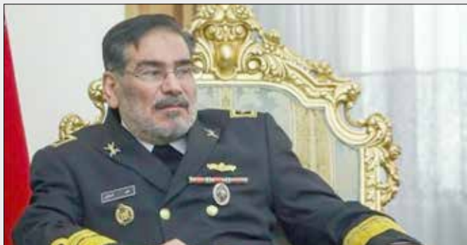
نگران کنندهای را برای اقتصاد جهانی به دنبال برنامہ ریزان، مجریان و پشتیبانی کنندگان از خواهد داشت و مسئولیت عواقب آن متوجه اینگونه اقدامات تحریک آمیز خواهد بود.

دبیر شورای عالی امنیت ملی گفت: با بررسی تصاویر ویدیویی موجود و شواهد اطلاعاتی جمع آوری شده، سرخ های اصلی ماجراجویی خطرناک حمله به نفتکش ایرانی در دریای سرخ بدست آمده است.