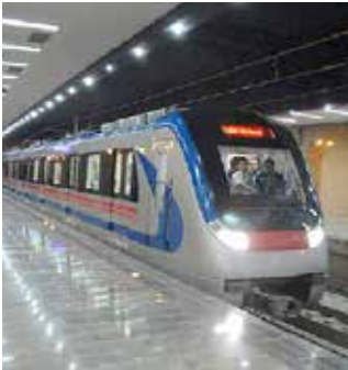
مطلوب تری را به شهروندان و مسافران محترم ارائه دهیم.