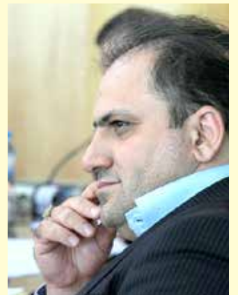
شهردار کرج گفت: در حال حاضر هفت درصد زباله های تولیدی شهروندان به صورت تفکیک شده جمع آوری می شود

و امیدواریم با ارتقای فرهنگ تفکیک زباله از مبدا این میزان تا سال آینده به ۱۵ درصد برسد. به گزارش «دنیای هوادار»، علی اصغر کمالی زاده با اشاره به اجرای طرح جمع آوری زباله از مبدا در شهر کرج گفت: این طرح پس از انتخاب پیمانکار جدید و با ساماندهی چرخ دستی ها آغاز شده است. وی با بیان اینکه چرخ دستی های کرج با پوشش آبی رنگ و با شعار «از خودمان آغاز کنیم» نسبت به جمع آوری زباله ها از مبدا اقدام می کنند، گفت: صد دستگاه وانت و ۱۰