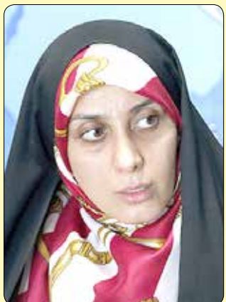
کنند چرا که این مساله باز خورد خوبی را برای ما به همراه نخواهد داشت.

معلول نیز در نظر گرفته شود. وی بر لزوم تقویت ورزش بانوان نیز تاکید کرد و اضافه کرد: به دلیل محدودیت های حضور بانوان ما در برخی از رشته های آبی، برای جلوگیری از بی انگیزه شدن فعالیت های ورزشی این قشر، در صورت کسب امتیازها و ثبت امتیازات آنان، نتایج آنان معادل سازی شده و سهمیه های مالی در نظر گرفته شده به آنان اختصاص داده شود. زرآبادی، اختلاف نظر و برخوردهای سلیقه ای در بخش حضور بانوان در ورزشگاه ها را باعث آسیب به ورزش کشور دانست و گفت: با توجه به اینکه هیچ منع قانونی و شرعی برای این حضور دیده نمی شود مسئولان کشور برای اینکه وارد چالش های بین المللی در این زمینه نشویم باید راه حل مناسبی را برای این مساله پیدا