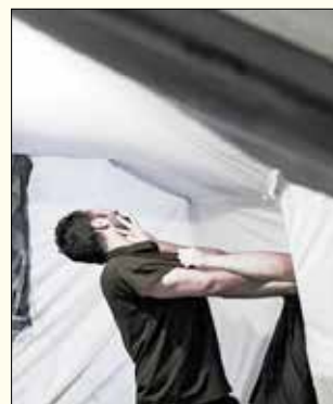
فیلمبرداری فیلم سینمایی «پروا» به کارگردانی مهراون مهبودیون بزودی تمام می شود.