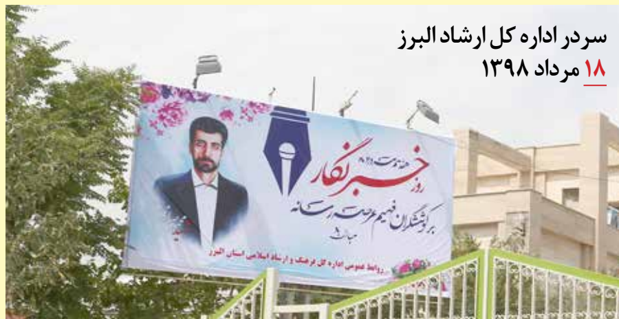
سردر اداره کل ارشاد البرز ۱۸ مرداد ۱۳۹۸