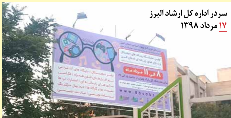
سردر اداره کل ارشاد البرز ۱۷ مرداد ۱۳۹۸