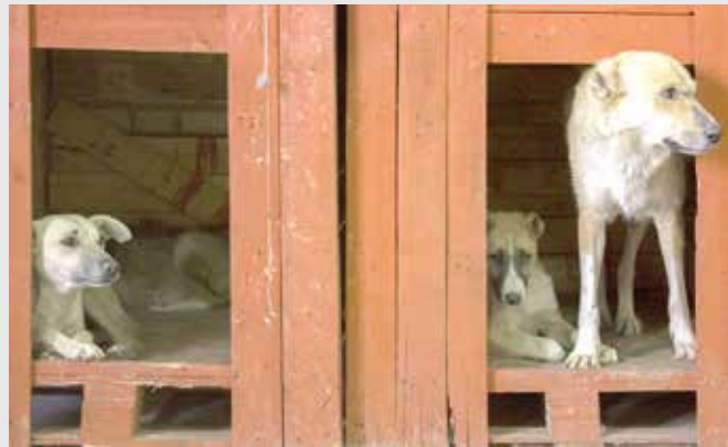
پناه گاهی برای سگ های بلاصاحب در مرکز دفن حلقه دره احداث کرده بود که در حال حاضر به دلیل افزایش این سگ ها، ظرفیت این پناه گاه تکمیل شده است.

و دهکده تفریحی گردشگری باغستان احداث دو پناهگاه و مرکز ویژه نگهداری از سگ های بلاصاحب را دستور کار خود قرار داده است.