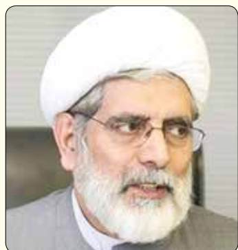
رفع حصر آقایان کروی، موسوی و خانم رهنورد انتظار داریم ما انتظار داشتیم با توجه به پیگیری ها و مکاتبات و ملاقات با رهبری، سرعت و شیب رفع حصر بیشتر باشد.

ما با برخی از مراجع قم هم دیدار داشته ایم و یکی از موارد مورد بحث ما درخواست کمک برای رفع حصر بوده آنها وعده دادند که با رهبری تماس گرفته و درباره حصر با ایشان صحبت کنند.