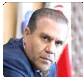
انتخابات آبروی نظام است و همه برابر قانون مسئول هستیم.

نزدیک شدن به موعد انتخابات مجلس یازدهم، گفت: باید از همه ظرفیت های موجود برای حضور حداکثری و مشارکت سیاسی مردم بهره مند شویم.