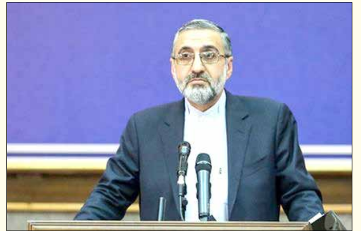
سختگوی قوه قضائیه با بیان اینکه نقد منصفانه را با دل و جان می پذیریم، گفت: ریاست قوه قضائیه اعلام کردند از هیچ کس شکایتی ندارند و بنای شکایت شخصی را نداشته و ندارند.

وی با تأکید بر رعایت اخلاق حرفه ای شغل خبرنگاری، افزود: انقلاب ما انقلاب فرهنگی است و با خبر آغاز شد و پیامبر ما به عنوان نبی یعنی کسی که در حوزه اطلاع رسانی و آگاهی بخشی جامعه بشریت از او یاد شده است بود لذا انقلاب ما انقلاب فرهنگی است و در حوزه فرهنگی نقش فرهنگ و رسانه در آگاهی بخشی مردم نقش موثری ایفا می کنند و در اثر اطلاع رسانی صحیح خبرگزاری ما در جامعه از بروز حوادث پیشگیری شده است. طبیعی است که این حوزه نقش آفرینی در آگاهی بخشی افکار جامعه دارد و الزامات خاص