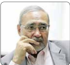
و توجه به مصالح بازنشستگان محقق خواهد شد.

دارد، صندوق بازنشستگی کشوری به مثابه ذخیره و پس انداز طولانی مدت جمع کثیری از بازنشستگان عزیز کشور، ضمن اتخاذ سیاستها و تدابیر عالمانه، به جایگاه واقعی خود در پایداری همه جانبه به ویژه عدم نیاز به استفاده از بودجه عمومی و ارائه خدمات شایسته به بازنشستگان عزیز بر گردد.