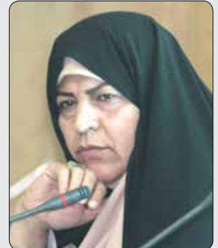
رئیس کمیسیون خدمات شهری و ایمنی شورای شهر کرج گفت: اگر چه بازارچه‌های

احداث شده بخشی از نیازهای شهروندان را تامین می‌کند اما وجود مشاغل کاذب در این بازارچه‌ها مشکلاتی را برای مردم به وجود آورده که نیازمند رسیدگی و بررسی‌های بیشتر شود.