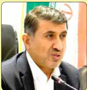
خودباوری بیشتری رسیده و ظرفیت های خود را ارتقا دهند.

استاندار البرز تاکید کرد: وعده های دولت را تا نیل به رضایتمندی مردم دنبال می کنیم