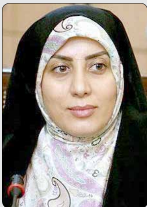
از درآمد کارخانه آبیگ به استان قزوین پرداخت نمی شود.

مردم متحمل ضرر و زیان می شوند و از سوی دیگر ممکن است تولیدکننده نیز نتواند به سود چندانی دست یابد. زرابادی تصریح کرد: کارخانه سیمان آبیگ در استان البرز وجود دارد و تنها، آلودگی این کارخانه به استان قزوین می رسد. عضو کمیسیون صنایع و معادن مجلس ادامه داد: براساس قانون صناعی که آلایندهی دارند باید سهم آلایندهی خود را به مراکز که باعث آلودگی آنها می شوند، پرداخت کنند این در حالی است که مبلغی