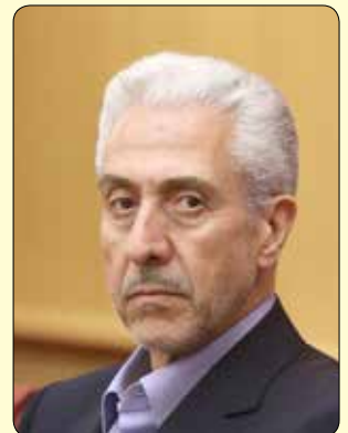
وزیر علوم با بیان اینکه متخلفان شبکه پیشرفته تقلب کنکور، داوطلب نبودند، گفت: این اتفاق در محل خاصی در یکی از استان ها رخ داد و قبل از اینکه متخلفان

داوطلبان آزمون سراسری با ایجاد شبکه ای متشکل از آزمون دهندگان، برگزار کنندگان آزمون و ایجاد تیم پشتیبان اقدام به ایجاد باندی سازمان یافته جهت تقلب کرده بودند. شبکه منهدم شده با فروش دستگاه card phonefe به مبلغ ۱۰ میلیون تا ۲۰ میلیون تومان به آزمون دهندگان قول قبولی در آزمون پزشکی را به آنها داده بودند، در این بین نیز افرادی از پرسنل آزمون که اقدام به خارج نمودن سوالات از بستر شبکه های اجتماعی از مخزن کرده بودند نیز پس از اقدامات اطلاعاتی و با همکاری حراست دانشگاه دستگیر و در اختیار مقامات قضائی قرار گرفتند.