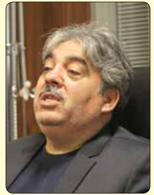
رئیس اتاق اصناف استان البرز گفت: انتقال مشاغل پر سر و صدا در البرز به خارج از شهر

به خارج از شهر منتقل شوند اما واژه مشاغل مزاحم برای این حرفه ها مناسب نیست زیرا کاسب حبیب خداست. وی در پایان توضیح داد: در کمیسیون نظارت بر اصناف مصوب شده تا برج اصناف و تمام اتحادیه های مرتبط نیز در مجتمع صنعتی صنعتی شیخ آباد مستقر شوند که این امر یکی از اهداف بلند مدت اتاق اصناف البرز است که تحقق آن، تحولات خوبی را به دنبال خواهد داشت.