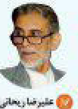
عنبر قاسم خانی

این هنرمند بزرگ و ارجمند در حوضه موسیقی، ابتدا با تریک نوروز بانسلی، آرزو کرد که سال ۹۷، سال موفقیت، بهبود اوضاع اقتصادی، آرامش، همدلی، ثابت و سرپلندی هر چه بیشتر ایران و ایرانی باشد.