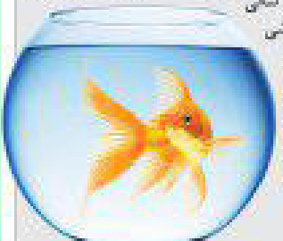
به سال نو سبزی و آرزو کنیم روزی روزگاری فرا برسد که آفتاب و طبیعت در محبتی سالم‌تر و شیرین‌تر به سر برسد

ماهی بوی عید و سیزده سیزده هفت‌سین این عطر خوب، لحظه‌هاییست که در فضا جاریست و پراشش انسان جز مرور این خاطرات با چیز دیگری زنده‌است! با یک و خالقه همه روزهای فشنگی که نگه‌دارم را می‌شود دیدم تا به لحظه شب عید و تعطیل سال نزدیک شویم در ذهن تک تک ما زنده می‌شود هنوز خالقه سبز کردن سیزده و سر زدن هر روز به جوله‌های ترد و نازک کتدم و مقایسه لحظه به لحظه آن با جوله‌های همدس خاله همبازی دیوار به دیوار، در کوچک‌های خاطرات کودکی می‌بجند. دوره کودکی ما با کودکی نسل جدید فرق دارد این روزها بچه‌ها سیزده را آماده می‌خورند و از انتخاب جوله زدن چیزی نمی‌دانند هم‌طور که مثل آن روزهای خوب ما شوق خرید ماهی و نگهداری آن تا سال آینده را ندارند شاید از بس که می‌خوانند و می‌شنوند از کمترین هزینه ماهی قرمز * یا همین نگرند گندم * و شاید اصلا حال و نوبت آن روزهای ما را ندارند! گذشته از همه کودکی ما و آنها و فرار از مقایسه روزهای این نسل و آن نسل آنچه حائز اهمیت است مرگ می‌صدا و استنثار آرام ماهی‌هایی است که تنها به پله شب عید و یا سیزده استنثار بعضی فروشندگان ماهی در فشنی تنگ و کوچک به میزان آسودگی می‌شوند در فضایی اشرف تنگ و بی‌هوا که وقتی به تنگ بطور کوچک حلقه ما می‌رسند گویی برای آنجایی می‌کنند برای زیستنی دوباره آفتوس که این برای کوچک نیز برای زیستن این موجودات زیبا و باارزش تاجرز است و شاید با گذشت آنان به آکوسیتیم طبیعی نیز محل آسایش دیگر موجودات شود.