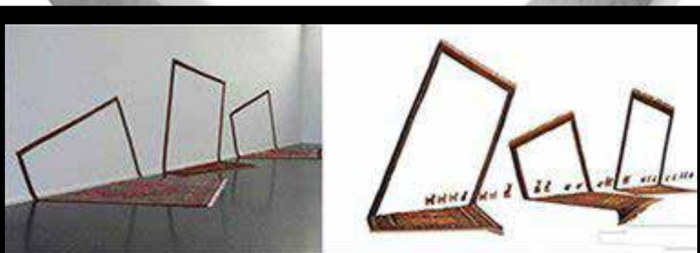
اثر گوگچه بآ (۲۰۱۶)