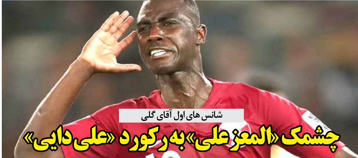
شانس های اول آقای گلی