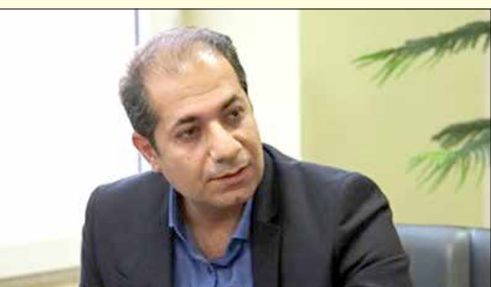
بضاعتی پور خبر داد؛

رئیس سازمان سیمامنظر و فضای سبز شهری شهرداری کرج اظهار داشت: در عملیات به زراعی فضای سبز شهری فعالیت های از قبیل کود دهی، کندو کوب، زیر و رو کردن خاک بستر باغچه های معابر و بوستان ها با هدف تنظیم و