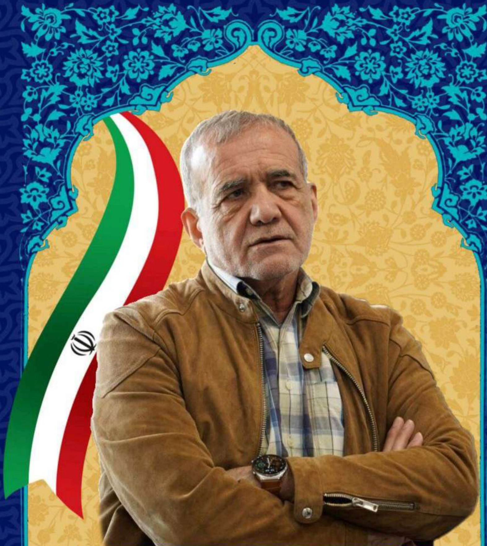
دکتر مسعود پزشکیان