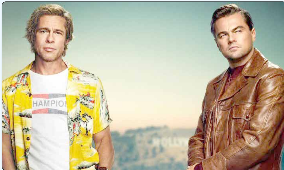
لئوناردو دی‌کاپریو و برد پیت در نمایی از فیلم «روزی روزگاری در هالیوود» ساخته کوئینتین تارانتینو