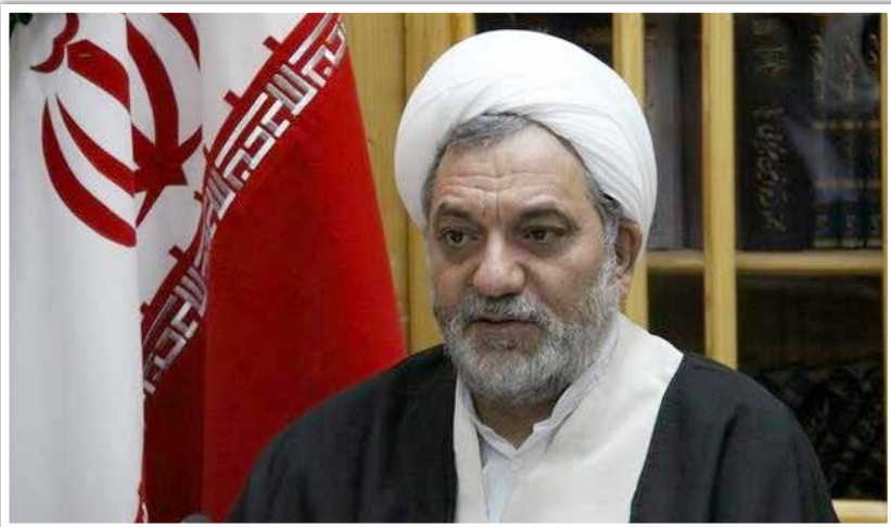
انقلاب اسلامی و همه مردم شریف ایران بویژه مردم استان کرمان و خانواده‌های این شهدای گرانقدر تسلیت می‌گویم و علو درجات را برای آن شهدای عزیز و شفای عاجل مجروحان از درگاه ایزد منان خواستارم.

اینجانب شهادت مظلومانه این عزیزان را به پیشگاه مقدس حضرت بقیة الله الاعظم (عج) و رهبر معظم