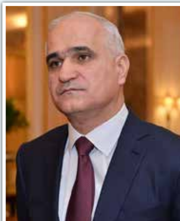
معاون نخست‌وزیر جمهوری آذربایجان با اشاره به افزایش ۴۶ درصدی تبادل کالا بین ایران و

دارد، گفت: پل قدیمی آستارا جوابگوی نیازهای ترانزیتی و تردد خودروها را نداشت و منجر به ترافیک کامیون‌ها در محور شده بود که با بهره برداری از این پروژه بخشی از مشکلات ترافیکی رفع می‌شود. وی از افزایش ۴۶ درصدی تبادل کالا بین دو کشور ایران و آذربایجان خبر داد و افزود: انتقال کالا بین این دو کشور ۴۵ درصد افزایش یافته است. معاون نخست وزیر جمهوری آذربایجان با تأکید بر لزوم تقویت زیرساخت‌های ترانزیتی بین این کشور و ایران بیان کرد: نیازمند احداث پل و راه‌های جدید برای توسعه ارتباط ایران و آذربایجان هستیم. مصطفی‌یف با اشاره به اهمیت احداث پل روگذر موقت پایانه مرزی آستارا بیان کرد: احداث این پل برای رشد ترانزیت و تبادل اقتصادی ایران و آذربایجان مؤثر است و موجب توسعه مندی کشورها می‌شود.