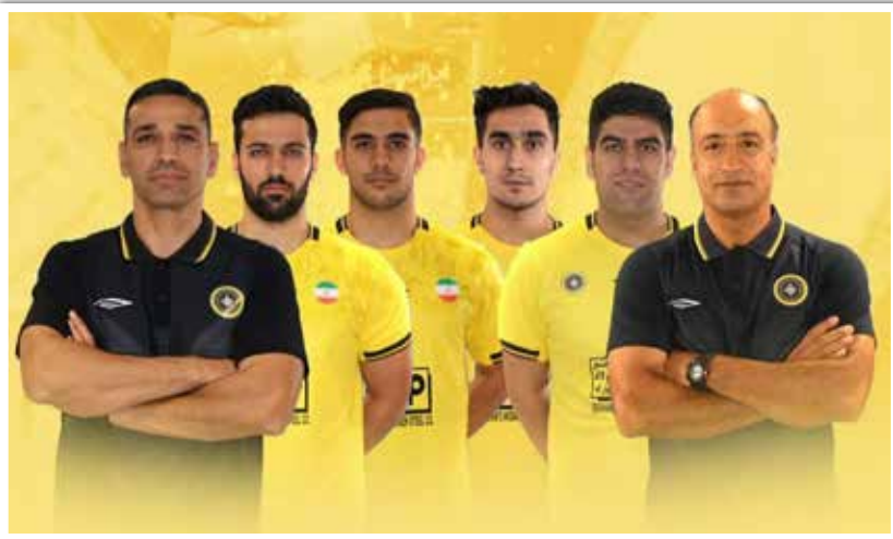
۲ مربی و ۷ بازیکن سپاهان به اردوهای اصغرقلندری

تیم ملی هندبال کشورمان دعوت شدند. به گزارش دنیای هوادار؛ نخستین اردوی آمادگی تیم ملی هندبال بزرگسالان برای حضور در مسابقات آسیایی انتخابی جهان با دعوت از ۲۲ بازیکن زیر نظر مجید رحیمی‌زاده سرمربی تیم ملی از هفدهم تا بیست و پنجم آذر ماه در تهران برگزار می‌شود.