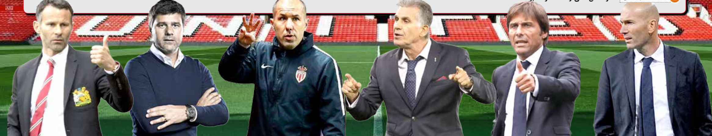
رایان گیگز، مائوریسیو پوچتینو، ئوناردو ژاردیم، کارلوس کی روش، انتونیو کونتته، زین الدین زیدان

اما قطعاً یکی از جذاب ترین گزینه ها برای نیمکت پر تلاطم منچستر یونایتد، اسطوره باشگاه است. «رایان گیگز» لژی که اکنون هدایت تیم ملی کشورش را بر عهده دارد و نتایج بدی کسب نکرده، از شاگردان خلف «الکس فرگوسن» است که بسیار هم مورد اعتماد اوست. همین که او از اسطوره های باشگاه به حساب می آید و افتخارات زیادی زیر نظر فرگوسن کسب کرده است، دلیل خوبی است برای اینکه گیگز منچستر یونایتد را بهتر و بیشتر از هر کسی بشناسد و در ثانی نزد بازیکنان باشگاه نیز ارج و قرب ویژه ای داشته باشد و از او حساب بیشتری ببرند. اتفاقی که برای «زیزو» در رئال مادرید افتاد و توانست آن شرایط کابوس وار رفا بنیتز را از یاد ببرد، باشگاه ها را به این وا داشته که از اسطوره های نامی خود که استعداد خوبی در مربیگری دارند استفاده کنند و «رایان گیگز» گزینه خوبی برای این منچستر یونایتد محسوب می شود.