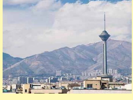
از گوش و کنار جهان

عامل دومی که برای بهبود کیفیت هوا از سوی کارشناسان معرفی می‌شود، وضعیت جوی تهران در پاییز اسماال است که با پاییز سال گذشته به کلی متفاوت است. دمای بالاتر هوا در اغلب روزه‌های آبان و آذر نسبت به ماه‌های مشابه پارسال سبب شده اسماال کمتر شاهد پدیده وارونگی هوا (اینورژن) و حبس آلاینده‌ها در لایه‌های پایینی جو باشیم. همچنین بارش باران بلافاصله پس از برخی از روزه‌های که هوا برای گروه‌های ناسالم حساس شد، به تلطیف هوا و کاهش غلظت آلاینده‌ها کمک زیادی کرد که نتیجه آن در کاهش محسوس تعداد روزه‌های ناسالم در سال جاری قابل مشاهده است. البته محاسبه سهم هر یک از دو عامل مذکور در بهبود کیفیت هوا نیازمند مدل‌سازی‌های دقیق و در نظر گرفتن تمام پارامترهای موثر بر کیفیت هوا در ایام مشابه اسماال و سال گذشته است.