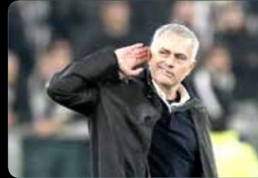
کامبک معجزه آساز «تورین» و واکنش به فحاشی هواداران یوونتوس