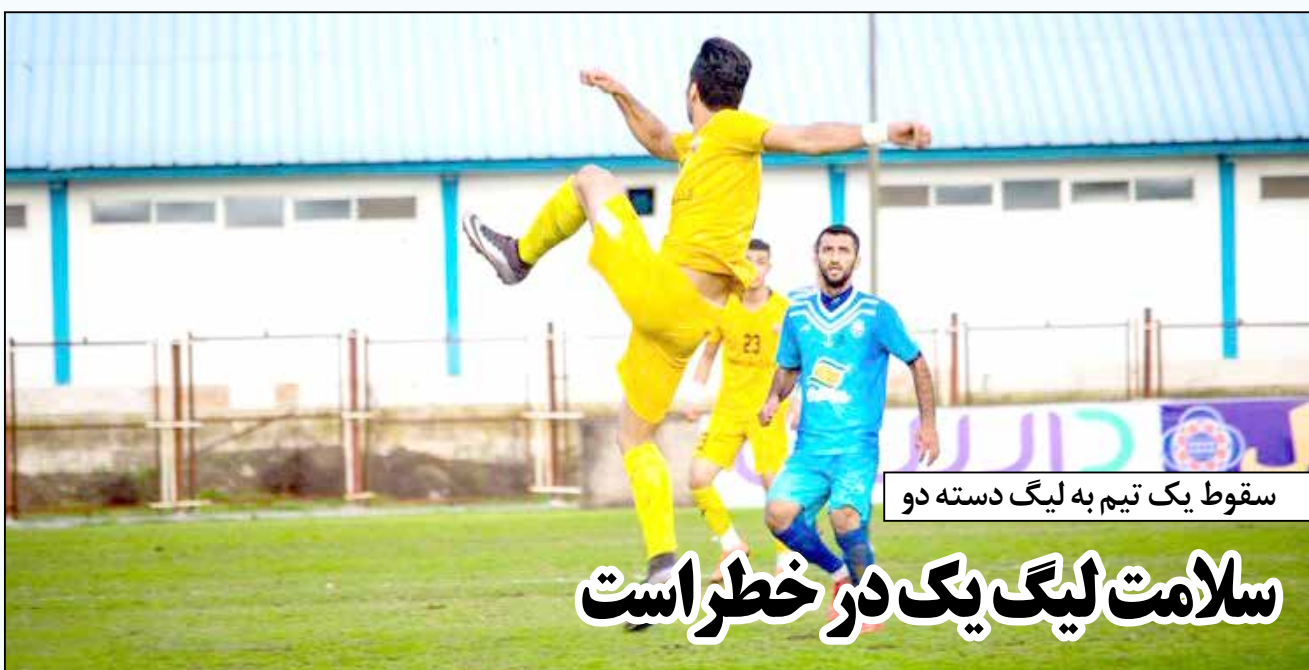
سقوط یک تیم به لیگ دسته دو

در واقع در داوران نیم فصل دوم، با پدیده جدیدی مواجه خواهیم بود که می تواند قضاوت داوران را در برابر تیم هایی که بیش از حد متضرر شده اند و یا بیش از حد سود بردند، تحت تأثیر قرار دهد. همان طور که پیش از این هم تا حدودی شاهد چنین اتفاقاتی بودیم، همیشه وقتی هم میانی علیه تیم خاصی می گیرد، خواه ناخواه قضاوت داوران در بازی های آن تیم را تحت تأثیر خود قرار دهد. چه برسد به حالا که آمار و ارقام هم در همین رابطه منتشر شده تا از این به بعد مشکلات جدیدی در زمینه داوران داشته باشیم.