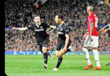
حذف ناباورانه به دست «سویا» از لیگ قهرمانان اروپا در اولدترافورد