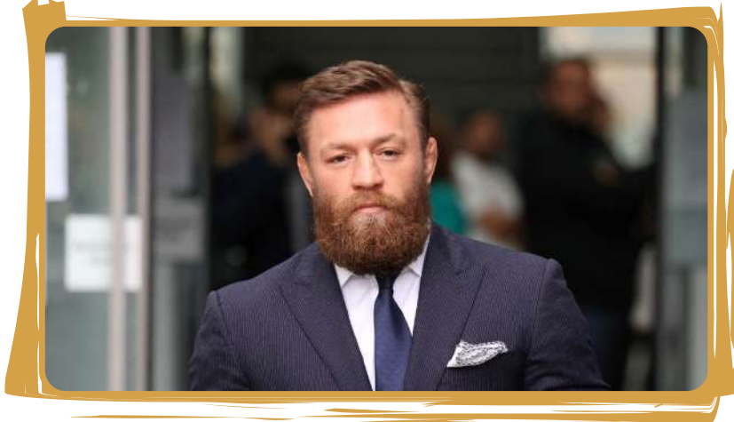
گرگور دیگر هرگز مبارزه نخواهد کرد. او همچنین احتمال مبارزه کانر مک گرگور و مایکل چندلر را کاملاً رد کرد. اخیراً تنها سجود بلکه حتی خود مایکل چندلر نیز