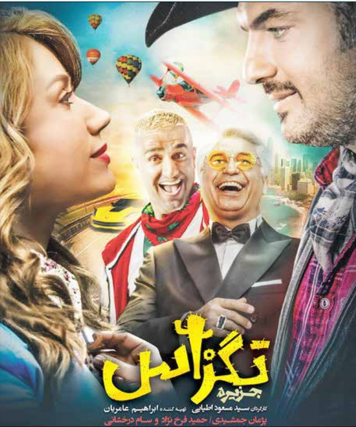
نمایی از فیلم «تگزاس» به کارگردانی بهرام براند

حتی بازه تر کردن آن هم نمی کند. چرا که اصلا کلیت فیلم بی دست و پاتر، سطحی تر و احمقانه تر از آن است که حضور فانتزی چنین کاراکتری کمکی به پیشبرد آن کند و حرف های گنده تر از دهانش بزندا وقتی اوج استفاده از ظرفیت و پتانسیل های حضور او در قصه صرف فرار کاراکتر بهرام با حوله او می شود دیگر چه انتظاری می توان داشت؟! راستی، سرنوشت برادر آلیس به کجا ختم شد؟! فیلم چه چیزی از او به ما می دهد که تمام اتفاقات، تعقیب و گریزها و جلوه های ویژه اش روی آن استوار است؟ نکته جالب تر ماجرا این است که «کارلوس» و دار و دسته اش پس از آزادی از زندان بدون کوچکترین پرسش و جستجویی در مورد اصل ماجرا که عامل همه این اتفاقات بوده، یعنی «برادر آلیس» به یکباره برای پیدا کردن بهرام و ساسان و آلیس قصد سفر به ایران را می کنند! البته «قصه» و «منطق» چه اهمیتی دارد؟ این تقصیر