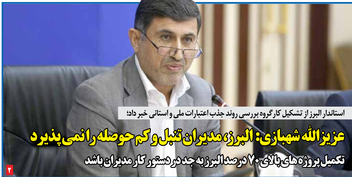
استاندار البرز از تشکیل کارگروه بررسی روند جذب اعتبارات ملی و استانی خبر داد؛

عزیز الله شهبازی: البرز، مدیران تنبل و کم حوصله را نمی‌پذیرد تکمیل پروژه های بالای ۷۰ درصد البرز به جد در دستور کار مدیران باشد