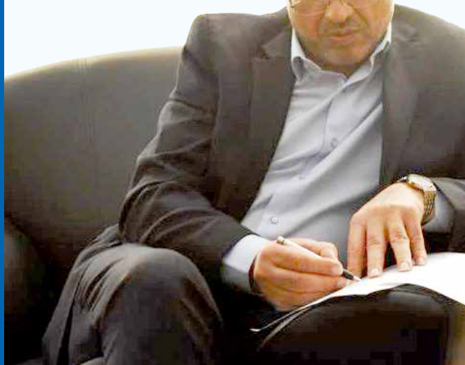
دکتر شهبازی در دیدار با خانواده شهدا ترکیان

از تمام نقاط استان بخصوص روستاها بازدید خواهیم کرد وی با تاکید بر ضرورت تداوم و استمرار دیدارهای مردمی توسط مدیران دستگاه های اجرایی گفت: «به طور قطع دیدارهای چهره به چهره با مردم در دستور برنامه ها قرار دارد و از تمامی نقاط استان و به خصوص روستاها و شهرستان ها بازدید خواهیم کرد.»