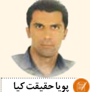
بویا حقیقت کیا

بالاخره پس از کش و قوس ها، اضطراب ها و دیدار های حساس فراوان، نیم فصل اول لیگ برتر ایران هم به پایان رسید و پرسپولیس ها با موفقیت هر چه تمام تر از این گردنه وحشتناک عبور کردند و به سلامت هم عبور کردند. آنها توانستند با کسب یک رتبه مطلوب در جدول لیگ و راهیابی به فینال لیگ قهرمانان آسیا، دوران محدودیتی و محرومیت از پنجره های نقل و انتقالاتی را با خاطرات خوش برای هواداران به اتمام برسانند. از حالا اما پنجره نقل و انتقالاتی پرسپولیس باز شده است و این تیم به مانند یک شیر زخمی که از زمین و بنا خبر های بد روی سرش آوار می شد، خودش را از زیر این آوار بیرون کشیده است و مطمئنانه از حالا رقبیب بسیار خطرناک تر و مدعی بسیار جدی تری در کورس قهرمانی خواهد بود و با آن تیم محافظه کار نیم فصل اول که برای گل نخوردن به میدان مسابقات می رفت، فاصله خواهد گرفت و خودش را آماده خواهد کرد تا تمام حرفان را از دم تیغ بگذرانند و برای کسب سومین قهرمانی متوالی در لیگ برتر، تمام توان خود را به کار گیرد. البته در کنار آن، جام حذفی و جام باشگاه های آسیا نیز در دسترس پرسپولیس هستند. با این وجود، نیم تگاهی می اندازیم، به باز یکنان مهمی که در نیم فصل به پرسپولیس اضافه خواهند شد.