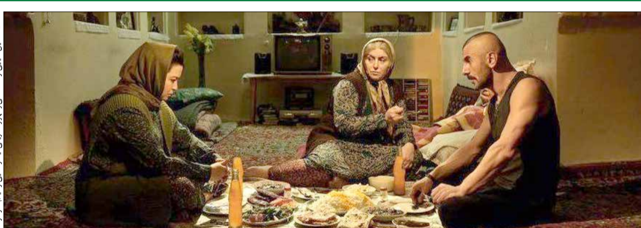
«دنیای هودار» از فیلم‌های احتمالی جشنواره فجر گزارش می دهد (۵)