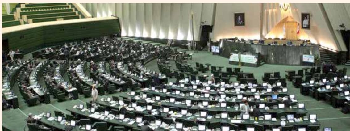
فرار از شفافیت، استیضاح های سریالی ...