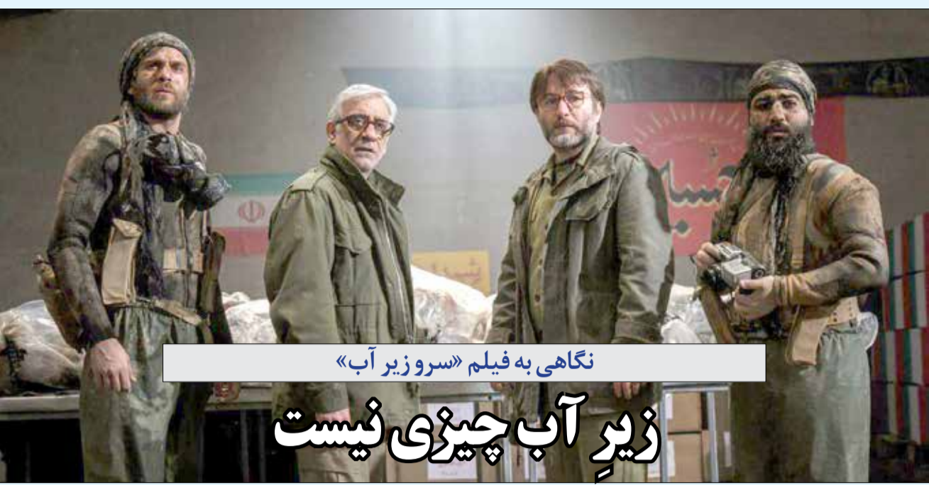
نگاهی به فیلم «سرو زیر آب»