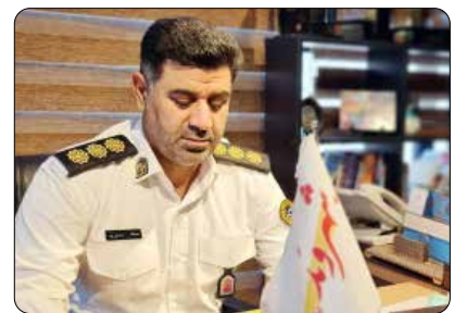
«عضو هیات علمی دانشگاه علوم پزشکی استان»:

سرنگ «مدالله رحمتی‌پور» - رئیس پلیس راهنمایی و رانندگی البرز - با بیان اینکه ۱۵ واحد نمایشگاه عرضه خودرو در این استان به دلیل نداشتن جواز کسب پلمب شدند، اظهار کرد: متصدیان این واحدهای متخلف علاوه بر پر کردن فضای پیاده روهای عمومی، اقدام به پارک دوبل در جلوی محل کسب کرده که به نوعی سد معبر ایجاد می‌کنند. پلیس طرح ویژه‌ای را برای برخورد با رانندگان متخلف در استان البرز اجرا کرده که به صورت مستمر ادامه خواهد داشت. همچنین در اجرای این طرح ۵۵ واحد متخلف نیز اخطار پلمب و یا اخطار کتبی دریافت کرده و ۵۰۲ دستگاه خودرو که در پیاده رو و یا به صورت دوبله پارک کرده بودند، اعمال قانون شد. پیاده روها جز معابر عمومی محسوب می‌شوند، با هرگونه تصرف این معابر طبق قانون برخورد قاطع می‌شود. به هیچ وجه اجازه تصرف این معابر عمومی به دیگران داده نمی‌شود چرا که با این اقدام غیرقانونی احتمال وقوع حوادث خطرات جبران‌ناپذیری برای عابران در پی خواهد داشت.