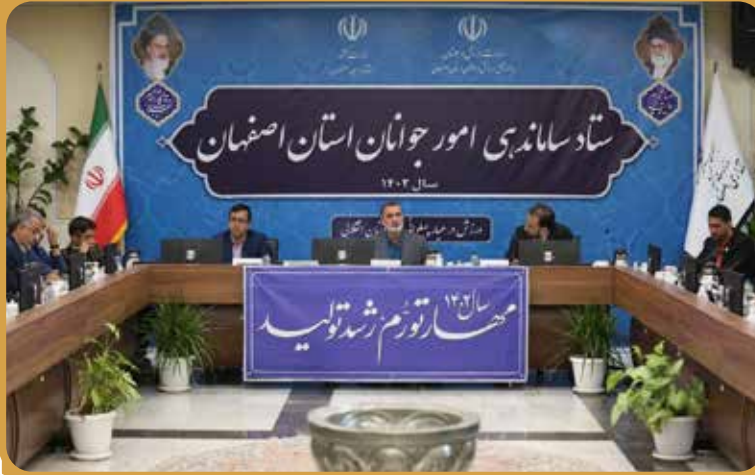
دستگاه‌ها و نهادها را می‌طلبد. رکن اصلی نشست ستاد ساماندهی؛ خدمت‌رسانی و تسهیل امور