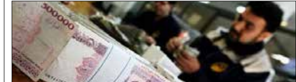
قدرت خرید چطور آب می‌رود؟