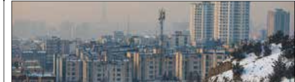
یک آمار ترسناک؛