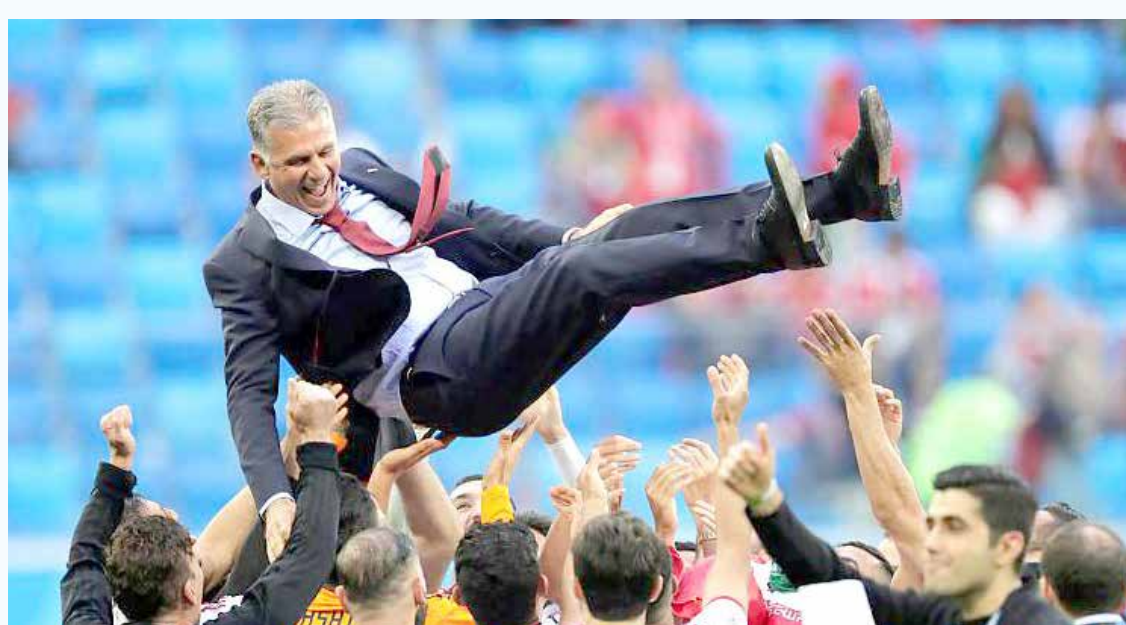
حال نوبت کی روش است

کاپیتان دوم تیم ملی ایران بعد از دو هفته مصدومیت آماده بازگشت به میدان است. لیست جدید تیم ملی ایران در حالی اعلام شد که کارلوس کی روش برخلاف اردوهای قبل نام نفرات آسیب دیده مثل علیرضا جهانبخش، مرتضی پورعلی گنجی، پژمان منتظری، سعید عزتاللهی و... را در این فهرست قرار نداد ولی در این بین اشکان دزآگه که طی دو هفته اخیر به دلیل مصدومیت دور از ترکیب تراکتورسازی بود را به