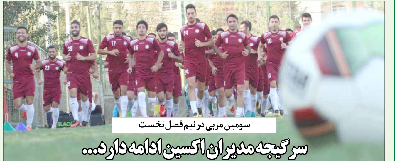
سومین مربی در نیم فصل نخست

وارد رقابت‌های باشگاهی کشور شوند که قطعا باعث برهم خوردن برنامه‌های فصل خواهد شد به همین دلیل فدراسیون با درخواست آنها موافقت نخواهد کرد. روز آیکاریان رئیس رئیس کمیته مسابقات فدراسیون بسکتبال در پاسخ به این سوال که آیا تبریزی‌ها به دنبال بازگشت به لیگ هستند؟ بیان کرد: هنوز نام‌های به دست ما نرسیده و من از طریق رسانه‌ها متوجه شدم اما آنطور که خبر دارم طی فردا و پس فردا می‌خواهند تصمیم نهایی را بگیرند.