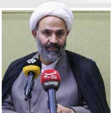
دلیل ما ورود می‌کنیم و حتماً اگر چنین موضوعی باشد در مسیر ابطال آن جلو خواهیم رفت.

«نصرت‌الله پژمان‌فر» رئیس کمیسیون اصل ۹۰ مجلس شورای اسلامی- اظهار داشت: در جریان پرونده ویلموتس اشتباهاتی روی داد که امروز نتایج آن را می‌بینیم. زمانی که مساله ویلموتس مطرح شد ما تشکیل پرونده دادیم و گزارش دقیقی را تنظیم کردیم تا موضوع پیگیری شود. کسی که می‌خواهد مسئولیتی را بپذیرد، باید احراز صلاحیت شود. بدون شک فردی که پرونده مفتوح دارد، احراز صلاحیت نمی‌شود. ممکن است متهم نباشد ولی هنوز احراز صلاحیت نشده؛ البته پرونده دیگری هم موجود است که شرایط دیگری دارد و این خطای بزرگی است که اجازه بدهیم چنین فردی در انتخابات شرکت کند. به همین دلیل خطای بزرگی است اگر مسیری که طی امروز طی شده را بخواهند ادامه بدهند یا به فردی که در این مسیر است، اجازه حضور در انتخابات داده شود. به همین