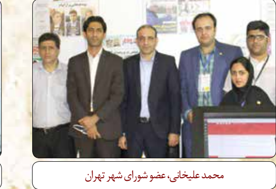
امیر محسنی، شهردار منطقه ۱۷ تهران