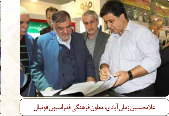
امیر محسنی، شهردار منطقه ۱۷ تهران