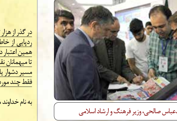
سیدعباس صالحی، وزیر فرهنگ و ارشاد اسلامی