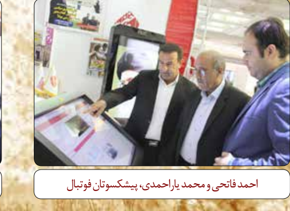
امیر محسنی، شهردار منطقه ۱۷ تهران