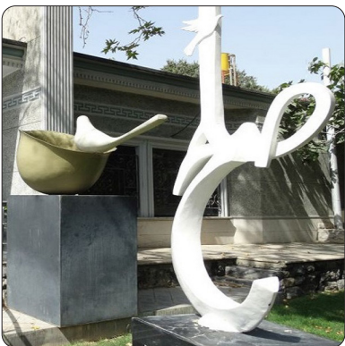
قربانی جنگ افزارهای شیمیایی در جهان پس از بمباران هسته ای هیروشیما نامیده شده است.

حادثه بمباران شیمیایی راهاندازی می‌شود، گفت: تعیین تکلیف زمین محل اجرای این طرح به اتمام رسیده و در اختیار سازمان میراث فرهنگی، صنایع دستی و گردشگری قرار گرفته است. در بمباران شیمیایی سردشت در هفتم تیر ۱۳۶۶ رژیم بعثی عراق با استفاده از بمب های شیمیایی چهار نقطه پر ازدحام شهر سردشت از توابع استان آذربایجان غربی را مورد حمله قرار داد. بمباران شیمیایی شهر مرزی سردشت فجیع ترین تهاجم شیمیایی بود که آثار و مشکلات منفی بسیاری بوجود آورد و این شهر اولین شهر