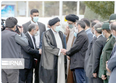
کلنگ‌زنی پنج‌هزار واحد طرح نهضت ملی مسکن ماهدشت

وزیر بهداشت در نشست شورای اداری فریدیس وزیر بهداشت یادآور شد: شهرستان فریدیس در کشور نمایانگر یک بی‌عدالتی