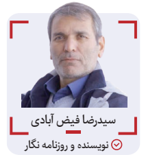
سیدرضا فیض آبادی نویسنده و روزنامه نگار

به محض اینکه وارد دفتر رییس فدراسیون گلف می‌شوید پیش از هر چیز، زمین مینی گلف به اضافه تعدادی چوب (پاتر) و توپ گلف نظر شما را جلب می‌کند و دکتر حمید عزیزی با خنده‌رویی تمام، شما را به سمت بازی هدایت می‌کند؛ «بفرمایید قبل از چایی یک‌دست بازی کنیم و بعد بریم سر دیگر مسائل!» البته یک آموزش دو سه دقیقه‌ای هم کافی است تا شما به سبک مایکل وودز با همان لباس شخصی و رسمی وارد بازی شوید. باری؛ یک ابتکار جالب از بچه‌های فدراسیون گلف باعث شده تا هر ایرانی که اراده کند زمین گلف را در خانه و محل کار و همراه خودش در مسافرت‌ها داشته باشد. یک‌رول چمن با طول تقریبی ۳ متر و عرض یک متر با برآمدگی در انتهای آن با یک چاله یا سوراخ که «سوراخ پات» گفته می‌شود، تشکیل‌دهنده زمین مینی گلف است و مجموع اینها به یک میلیون تومان هم نمی‌رسد. اما کدام رشته ورزشی را سراغ دارید که با یک میلیون تومان تمام اجزای آن را بدست بیاورید و با خانواده و دوستان و همکاران خود ساعت‌ها سرگرم بازی شوید.