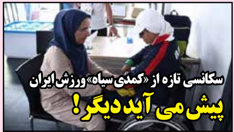
سکانتسی تازه از «کبدمی سپاه» ورزش ایران پیش می آید دیگر!