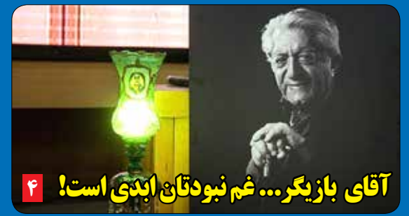
آقای بازیگر... غم نبودن ابدی است! ۴

«دنیای هوادار» به یاد روح قلم زنده یاد ناصر احمدپور منتشر می شود