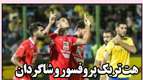
هت تریک پروفیسور و شاگردان