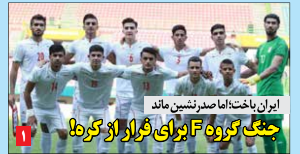
ایران باخت؛ اما صدر نشین ماند جنگ گروه F برای فرار از کره!

«دنیای هوادار» به یاد روح قلم زنده یاد ناصر احمدپور منتشر می شود