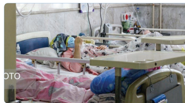
بنابر اعلام مرکز روابط عمومی و اطلاع‌رسانی وزارت بهداشت، در شبانه روز گذشته و بر اساس معیارهای

گویا در پایان درباره تقسیم بندی سنی برای تزریق دوز سوم واکسن کرونا تأکید کرد: تقسیم بندی سنی برای تزریق دوز سوم واکسن کرونا برای جلوگیری از ازدحام جمعیت در مراکز واکسیناسیون اعمال شده است و این مورد به مراتب کاهش پیدا می‌کند و تمام گروه‌های سنی واکسن کرونا را دریافت خواهند کرد. برای تزریق دوز سوم واکسن کرونا بیشترین تکیه ما به واکسن‌های ایرانی است و خیالمان از این جهت راحت است.