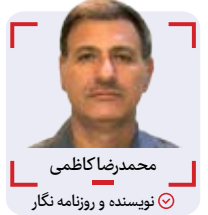
محمد رضا کاظمی نویسنده و روزنامه نگار