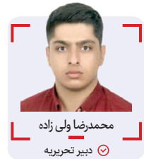
محمدرضا ولی زاده دبیر تحریریه

جدال پرسپولیس و نساجی در هفته دوم رقابت‌های لیگ برتر با پیروزی دو گل شاگردان یحیی گل محمدی به پایان رسید تا پرسپولیس با بریس مهدی مهدوی کیا به کورس مدعیان لیگ بیست و یکم بپیوندد.