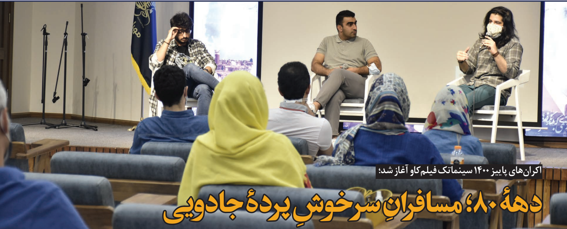
اکران‌های پاییز ۱۴۰۰ سینماتک فیلم‌کاو آغاز شد؛