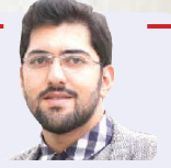
رضا شاعری نویسنده

مجموعه دریافت‌ها، ذهنیت‌ها، انگیزه‌ها و اقدامات حاج قاسم در تعامل با محیط و افرادی که با او در ارتباط بودند، برگرفته شده از شخصیت فردی و تربیت صحیح و الگوها و همچنین صفات و ویژگی‌هایی بود که در طول مسیر با تجربه‌ها آمیخته شده بود. کاظمی درباره شخصیت و جایگاه حقیقی و حقوقی حاج قاسم گفت: «جایگاه حقوقی او برای من بسیار ارزشمند بود و من به پاسداشت این جایگاه در مراسم سخنرانی که در قنات‌ملک داشتم، در حضور جمع دعوت شده، دست پدر حاج قاسم (مش‌حسن آقا) را به پاس تربیت صحیح و پرورش این صفات شخصیتی بوسیدم.» وی ادامه داد: «آنگونه که به فرمانده و شخصیت او که فکر می‌کنم اذعان می‌کنم که شخصیت او یک شخصیت برجسته بود. ما بسیاری از ابعاد شخصیتی این شهید را بعد از شهادت شناختیم و اخلاص و عمل در کلام و رفتار او در همه ابعاد جاری و ساری بود. سپهبد شهید اسلام در همه احوال اهل دلجویی بود. سال گذشته و بعد از شهادت او، مادرم که زنی سال‌خورده است برای تسلیت با من تماس