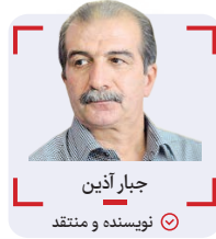
جبار آذین نویسنده و منتقد

انواع بیماری‌ها و تخریب‌ها و آسیب‌ها است، ملت، از شما انتظار معجزه ندارند، چرا که شما معجزه‌گر و جادوگر نیستید و مردم هم چنین تصویری ندارند، لیکن دست کم، برای شنیدن فریادهای زخمی مردم و اهالی فرهنگ و هنر و رسانه، گوش شنوا داشته باشید و اگر نمی‌شود و نمی‌توانید مجری برنامه‌های ملی و فراگیر و بنیادین باشید، حداقل از کسانی برای اداره کشور استفاده کنید که از سلامت، صداقت، تخصص و تعهد و خداپاوری و مردم دوستی بهره‌مند باشند. در سالیان اخیر، هرکه بر صندلی‌های ارشاد و سینما و هنر نشست، تخریب به بار