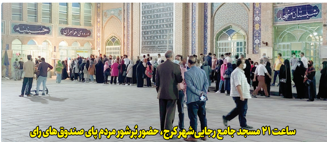
ساعت ۲۱ مسجد جامع رجایی شهر کرج، حضور پرشور مردم پای صندوق های رای