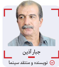
جبران آذین نویسنده و منتقد سینما

ساز از روی برنامه‌ها و سریال‌های ماهواره‌ای شده است. آن‌ها که هنوز و به ناچار در بازار مکاره‌های سیما فیلم و شبکه خانگی تلویزیون سرمایه/رفیق/ و سلیقه مدار، برای کار در سیما، دست و پا می‌زنند، از دو نرخ شدن تلویزیون بحث می‌کنند. نرخ‌های چندین میلیاردی که مختص بی‌هنران نور چشمی است وزیر و در حد یک میلیاردی که از آن تولیدکنندگان کاربلد برنامه و سریال ساز است. در واقع در تلویزیون ملی! به علت سیطره نگاه ارباب سالارانه! نوعی مناسبات ارباب و رعیتی حاکم است. به دلیل مدیریت غلط، مناسبات ناپسند و زد و بندهای آشکار و نهان و حمایت‌های رفاقتی/فامیلی با رویکرد سیاسی/تجاری، تلویزیون پر شده از برنامه‌های دست‌چندم چند میلیاردی کپی شده و سریال‌های زیر متوسط و بد، باز هم کپی شده از سریال‌های ترکیه‌ای، آمریکایی و...! تلویزیون به لطف مدیریت شایسته! سفارش‌های این و آن، فرمایش‌های اسپانسرها، پول‌های سرازیر شده به صدا و سیما را در قالب تولید فیلم و برنامه و سریال و... به عده‌ای مشخص از نوادگان می‌دهد. نام‌های دلچک‌ها و تلخ‌ها و ملیچک‌ها، همچنان در میان نوادگان می‌درخشد! در اسر سریال‌سازان خودی هم که در یک دهه اخیر، هم از اینجا می‌خورند و هم آنجا و نام‌هایشان به کرات به